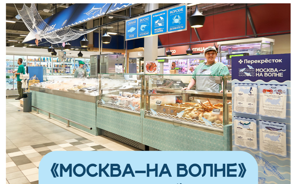
РЫБНЫЙ РЫНОК «МОСКВА–НА ВОЛНЕ»